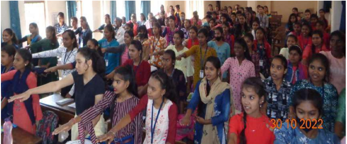
एकता की शपथ